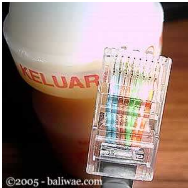
urutan pin TIDAK standar

Dan kalau yang ini tidak standar, coba perhatikan urutan warna pinnya, sangat tidak standar, tapi tetap saja bisa, yang penting korespondensinya satu satu (khusus tipe straight):