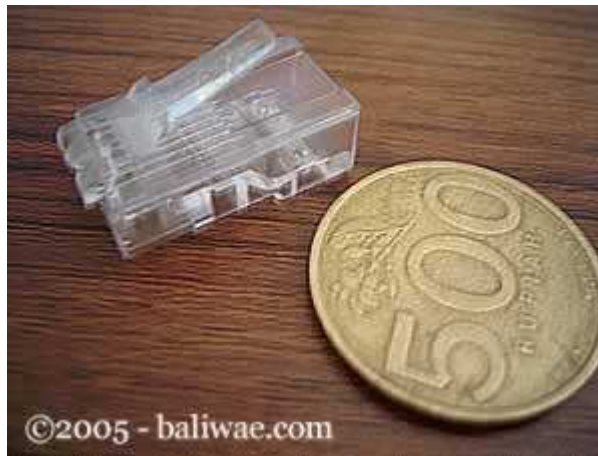
Foto RJ - 45 yang masih baru, belum di gencet pake tang

Satu lagi yang sangat penting, Anda harus punya tang khusus buat memasang konektor ke kabel UTP, istilah kerennya adalah "crimp tool". Alat ini gunanya untuk 'mematikan' atau 'menanam' konektor ke kabel UTP. Jadi sekali sudah di 'tang', maka sudah tidak bisa dicopot lagi konektornya. Dan kalau mau yang lebih OK, biar tidak nanggung maka beli pula sebuah LAN tester. Anda bisa membeli yang merek dari Taiwan saja agar lebih murah. Bentuknya seperti kotak dan ada lampu LED-nya delapan pasang dan bisa kedap-kedip.